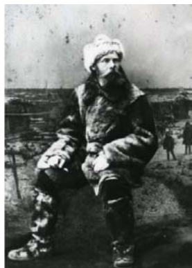
Bild 5 Polarforskaren baron Eduard Toll (A IX:1, 1858 - 1902)