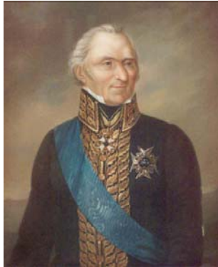
Bild 8 Svenske fältmarskalken greve Johan Christopher Toll (1743 - 1817)

Av hans barn blev den yngste sonen Johan Christopher ( bild 8 ) den Tollska släktens mest berömde medlem. 28 Femtonårig deltog han 1758 som frivillig i det resultatlösa pommerska kriget mot Preussen, liksom sina båda äldre bröder, men när han inte lyckades bli mer än underofficer, trots att han hade sin morbror fältmarskalken Marcks von Würtemberg som regementschef, tog han avsked efter sex år, säkert utan att ana att han ytterligare tre gånger skulle återkomma till Pommern, som fästningsfånge, som generalguvernör över Skåne för att pantsätta Wismar till hertigen av Mecklenburg-Schwerin och som svensk överbefälhavare i kriget mot Napoleon. Efter juridiska studier, som resulterade i en rekordsnabb examen och en snart avbruten bana som domare, och en tjänst som överjägmästare i Kristianstads län, begynte Johan Christopher Toll sin verkliga karriär, som ehuru militär var ovanligt oblodig, med revolutionen i Kristianstad 1772, ett motstycke till Gustaf III:s revolution i Stockholm, och vid vilken icke en droppe blod utgöts – en karriär, som nådde sin höjdpunkt, när han blev fältmarskalk, inte efter ett slag till priset för stora förluster utan efter att med sin diplomatiska förmåga ha räddat hela den svenska armén från Pommern till Sverige med alla förråd undan Napoleon.