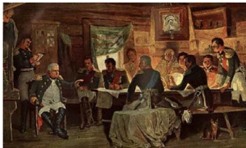
Bild 10 "Krigsrådet i Fili", när Kutuzov efter slaget vid Borodino beslöt att uppgiva Moskva. Berömd målning av A. Kivschenko 1880. Till vänster sitter Kutuzov, den andre från höger är general Karl Toll