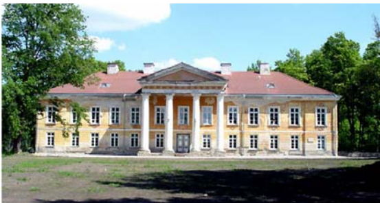
Bild 9 Arroküll i Estland