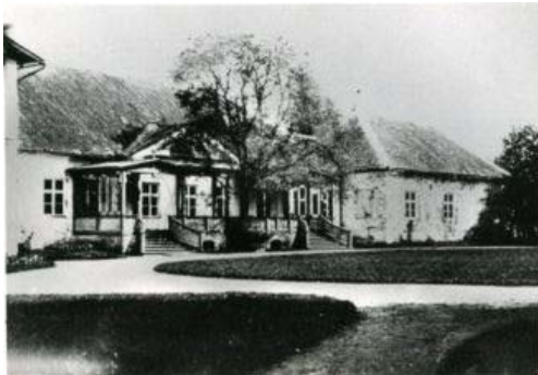
Bild 3 Kuckers i Estland